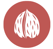
Frutos de cáscara