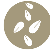
Granos de sésamo