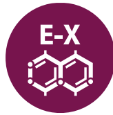
Dióxido de azufre y sulfitos